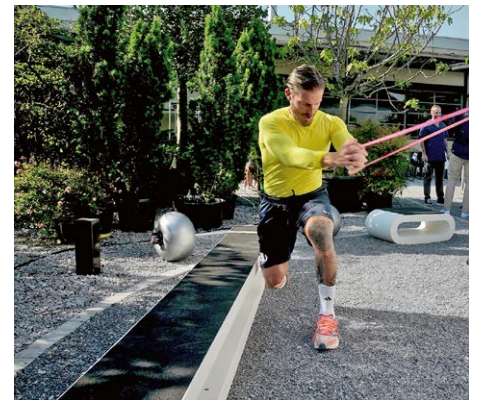
Outdoor-Fitnessgeräte vereinen körperliches Training und Naturerlebnis.

zeit, sondern um komplexe Geräte, die definierte Sicherheitsstandards erfüllen und witterungsbeständig sein müssen.